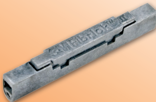
FIBRLOK™ II 2529