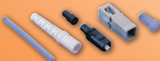
Konektor SC Hot Melt