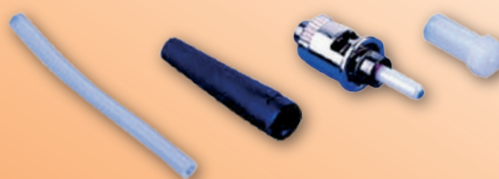
Konektor ST Hot Melt